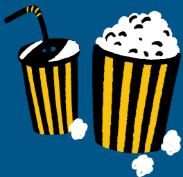
Popcorn och cola på bio

Som lägst kostar ett medlemskap mindre än 15 euro per månad – för samma pris som du betalar för