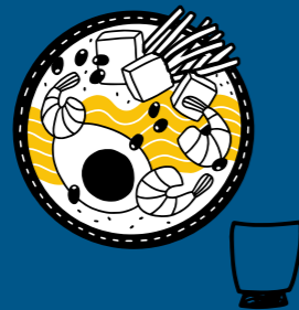
Lunch inklusive dryck