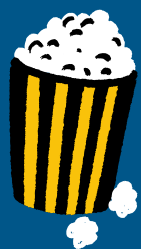
Popcorn på bio